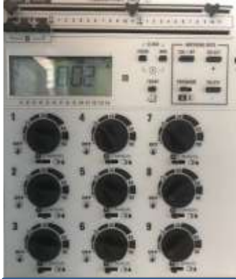
Steuerung Regner mit Bedienungsanleitung ausgerüstet