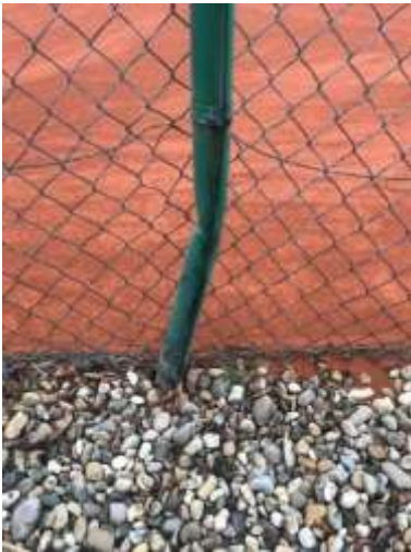
Platz 6: gegenüber Clubhaus