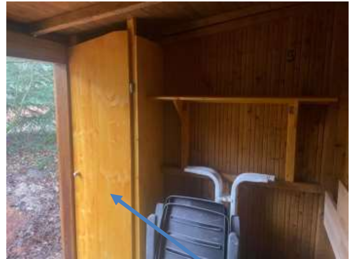
Abstellkammer für Werkzeuge