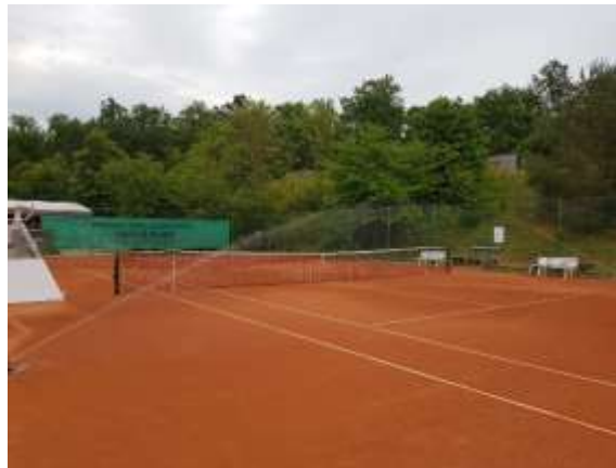
Platz 6 und Platz 7

Hier ist zu erkennen wie gleichmäßig die Beregnung arbeitet.