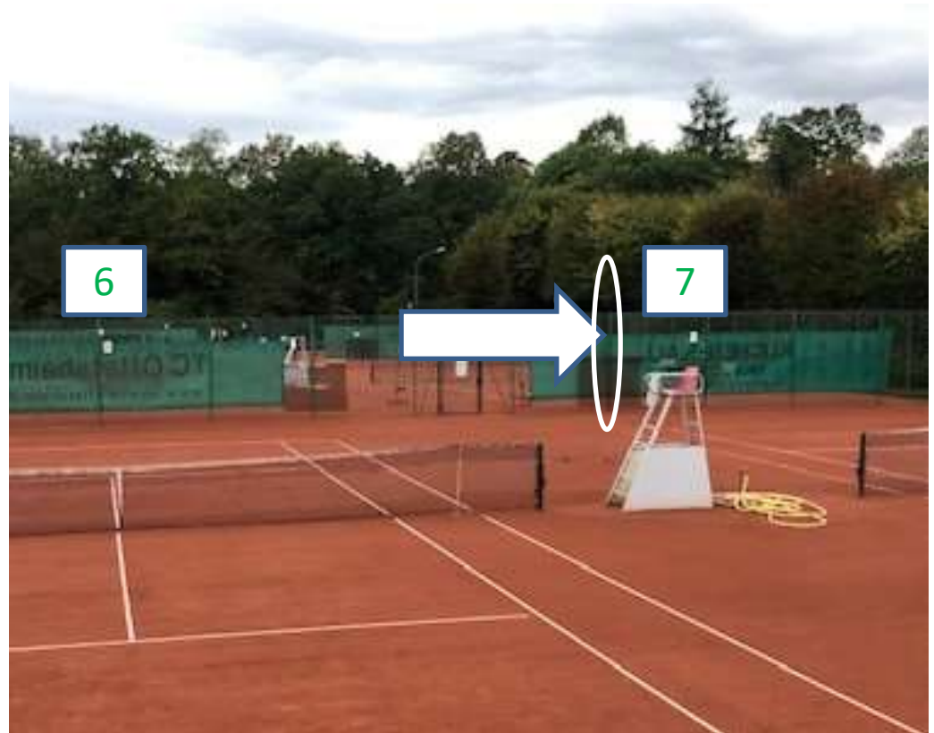
Platz 7: Hier ist auch ein Zaunpfosten lose (durch Rost) dieser müsste fixiert werden.